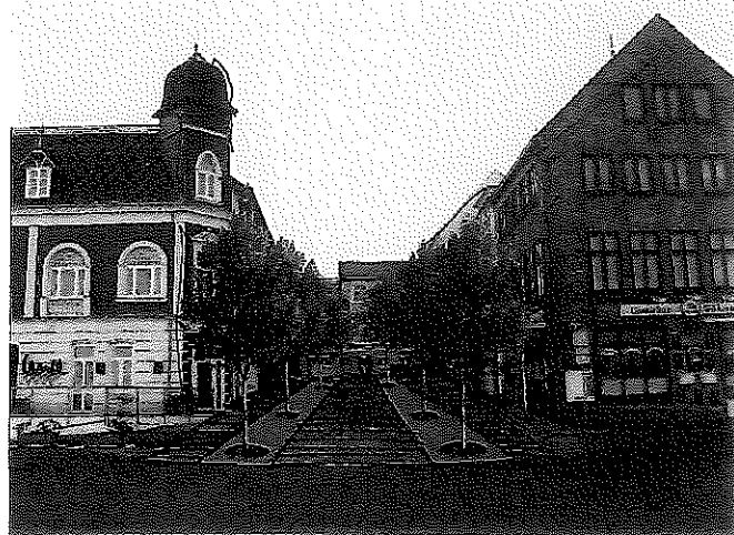
Testskizze neuer Eingang am Fährberg