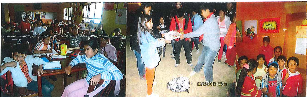
Hausaufgabenhilfe im Kinderhort in Bolivien. Bild Mitte: Bei Feiern wird auch der Pacha Mama (Mutter Erde) geopfert.