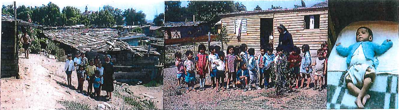
Die Anfänge in den 70er Jahren