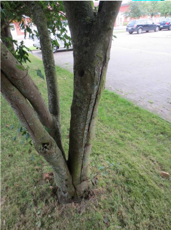
Ersatzpflanzung vor Ort

zu 87.: Parkplatz Kieler Straße mehrst. Ahorn: Bruchgefahr = Fällung