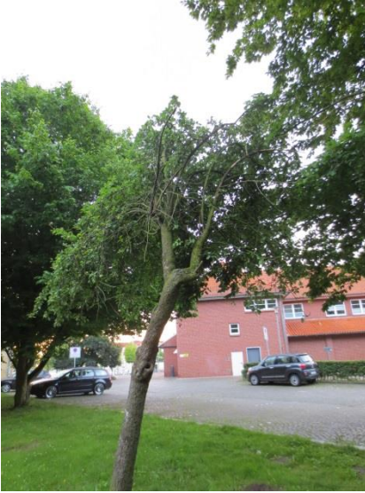
Ersatz = Apfelbaum

zu 30.: Obstwiese am Rathaus Apfelbaum: Bruchgefahr = Fällung