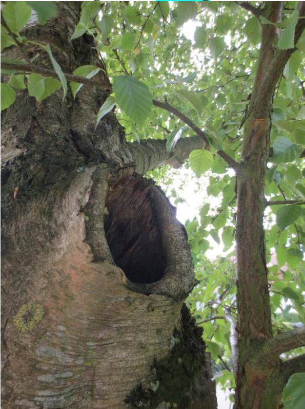
Ersatzpflanzung vor Ort

zu 74.: Pflanzstreifen Neuheim Birke: Bruchgefahr = Fällung