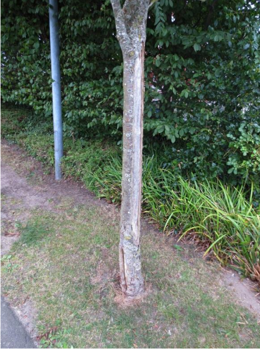
Ersatzpflanzung an anderer Stelle

zweit- und drittletzte Vogelbeere: große Wunden = Rodung/Fällung