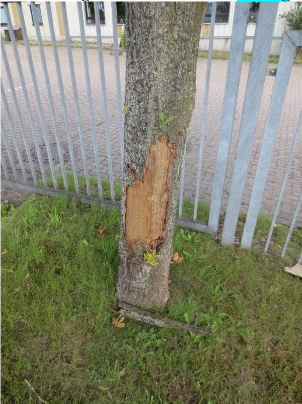
Ersatzpflanzung vor Ort

zu 76.: Pflanzstreifen Mehldiek Eiche: sehr große Stammwunde = Fällung