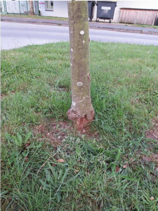
Ersatz = 1 Säulenweißbuche

zu 89.: Verkehrsinsel Holtenauer Str. (Kindergarten) Vogelbeere: sehr große Stammfußwunde = Fällung