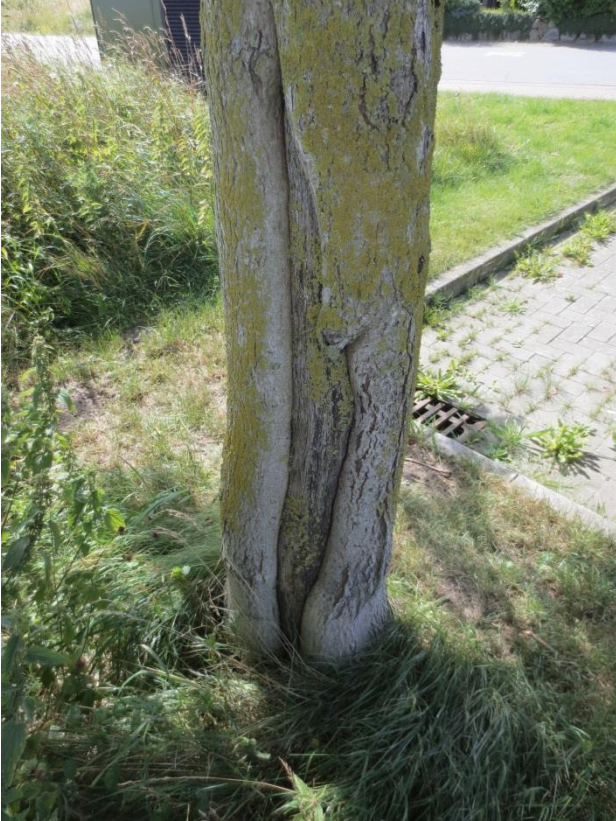
Ersatzpflanzung vor Ort

zu 67.: Parkplatz Süeskoppel Feldahorn: sehr große Stammwunde = Fällung