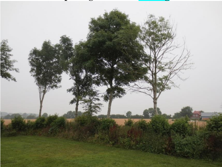
Ersatzpflanzung vor Ort

zu 69.: Spielplatz Stutebüll Esche: fast kompl. Abgestorben = Fällung