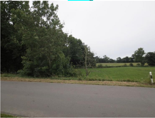
Ersatzpflanzung vor Ort

zu 113.a): Weidefelder Weg abgestorbene Erle = Fällung