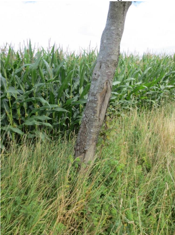
Ersatzpflanzung vor Ort

drei Eschen (vor Wendehammer beim „Lobster“) = auf den Stock setzen