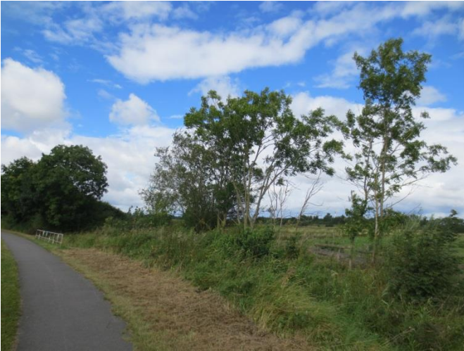
Mehlbeere: sehr große Stammwunde = Fällung