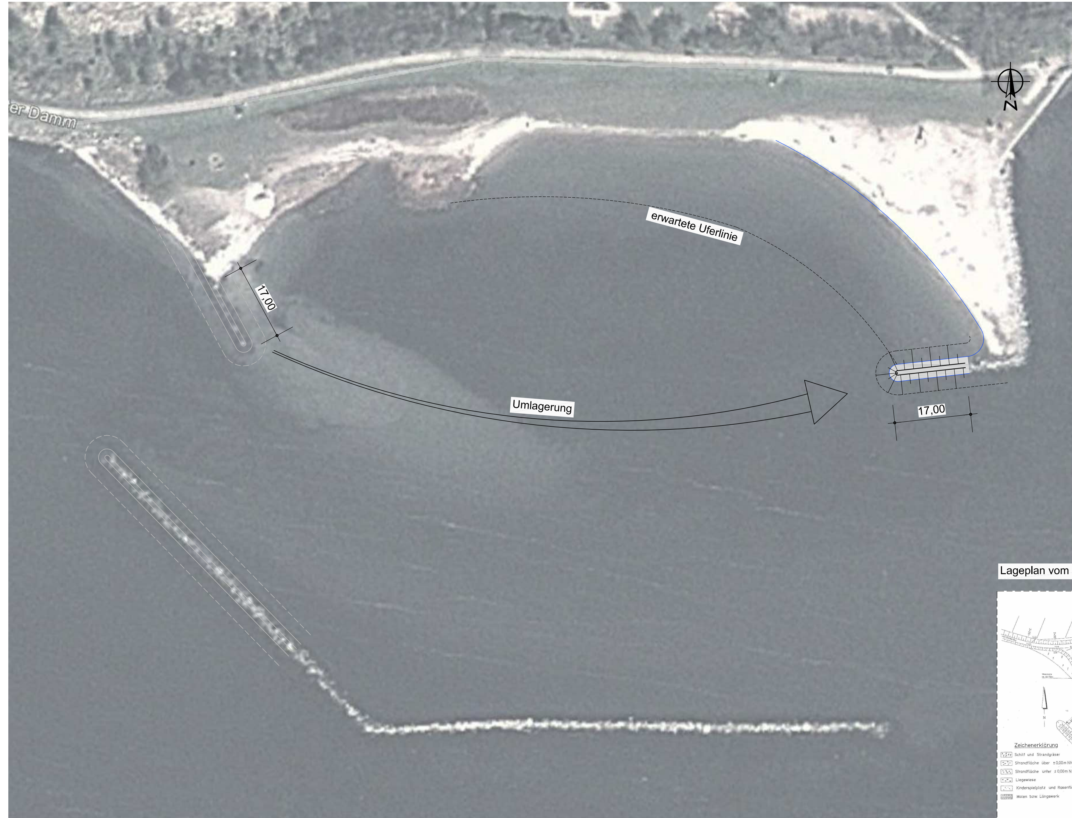
Lageplan vom 17.02.1985 M. 1:2.000