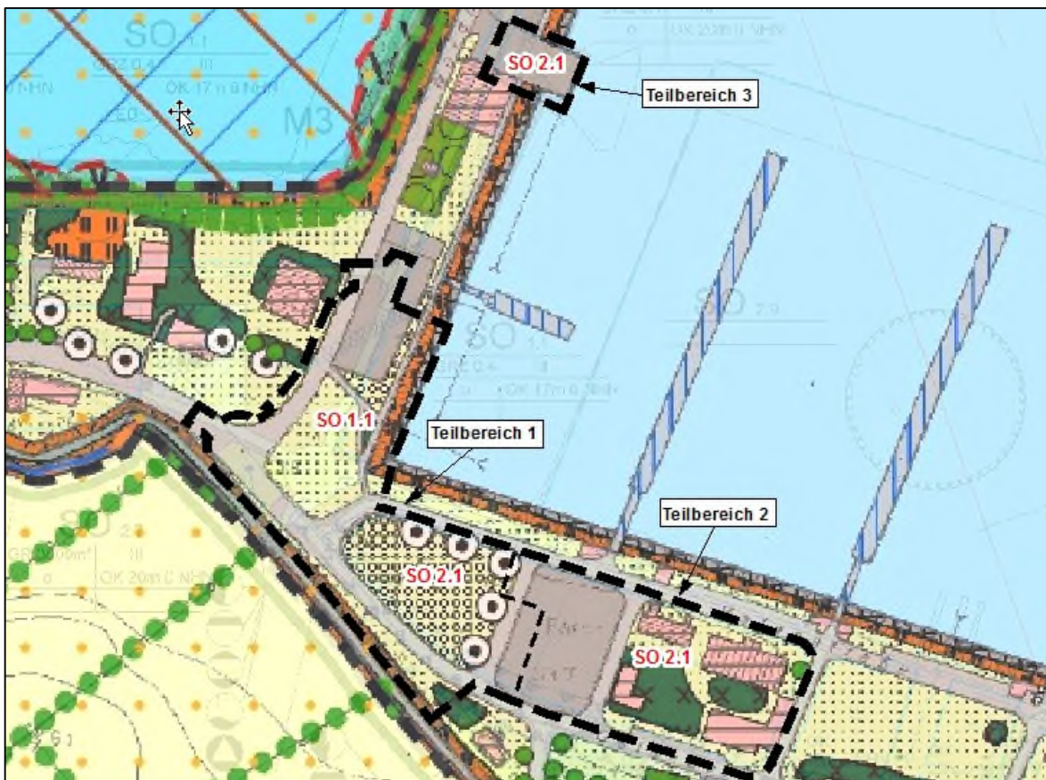
Abb. 1: Ausschnitt aus dem Bestandsplan des Landschaftsplanerischen Fachbeitrags zum B-Plan 65 (Stand 2009)

Im Gebiet ist derzeit folgender Baumbestand vorhanden: eine Baumreihe aus ca. 20 Kugel-Ahornen mit Stammdurchmessern von 10 cm, ca. 25 einzeln, in Gruppen oder Reihen stehende Feld-Ahorne, Eichen, Pappeln, Robinien und Linden mit Stammdurchmessern von 10-25 cm sowie eine Pappel mit 50 cm Stammdurchmesser.