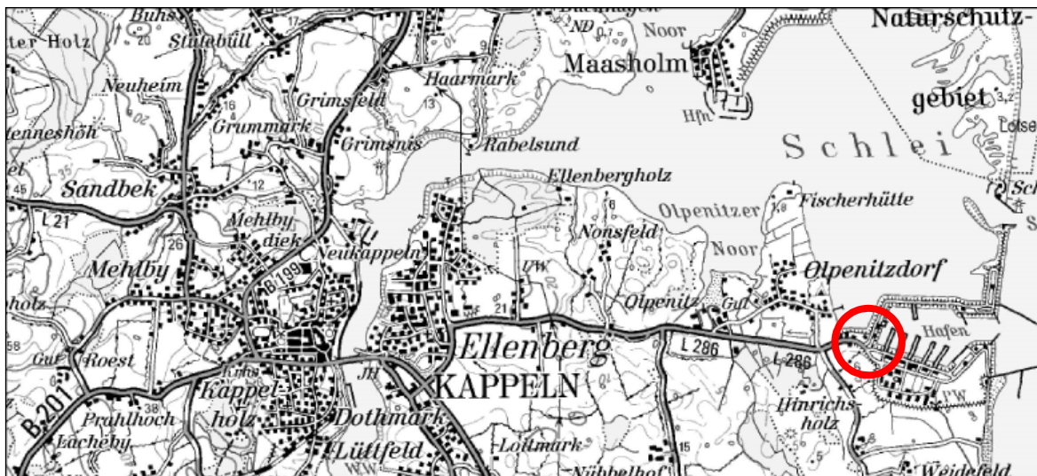
Abb. 1: Lage des Vorhabens (Quelle: TOP 25.000, unmaßstäblich)

Auf dem ehemaligen Marinestützpunkt "Port Olpenitz" wird seit dem Jahr 2009 unter den Vorgaben des B-Plans Nr. 65 der Stadt Kappeln ein Ferienresort entwickelt. Aufgrund zwischenzeitlich geänderter Teilziele sind bereits mehrere Planänderungen erfolgt. Um die Situation bezüglich der Lebensmittelversorgung aufzuwerten stellt die Stadt Kappeln die 9. Änderung des Bebauungsplans Nr. 65 "Port Olpenitz" auf. Der Geltungsbereich umfasst drei Teilbereiche.