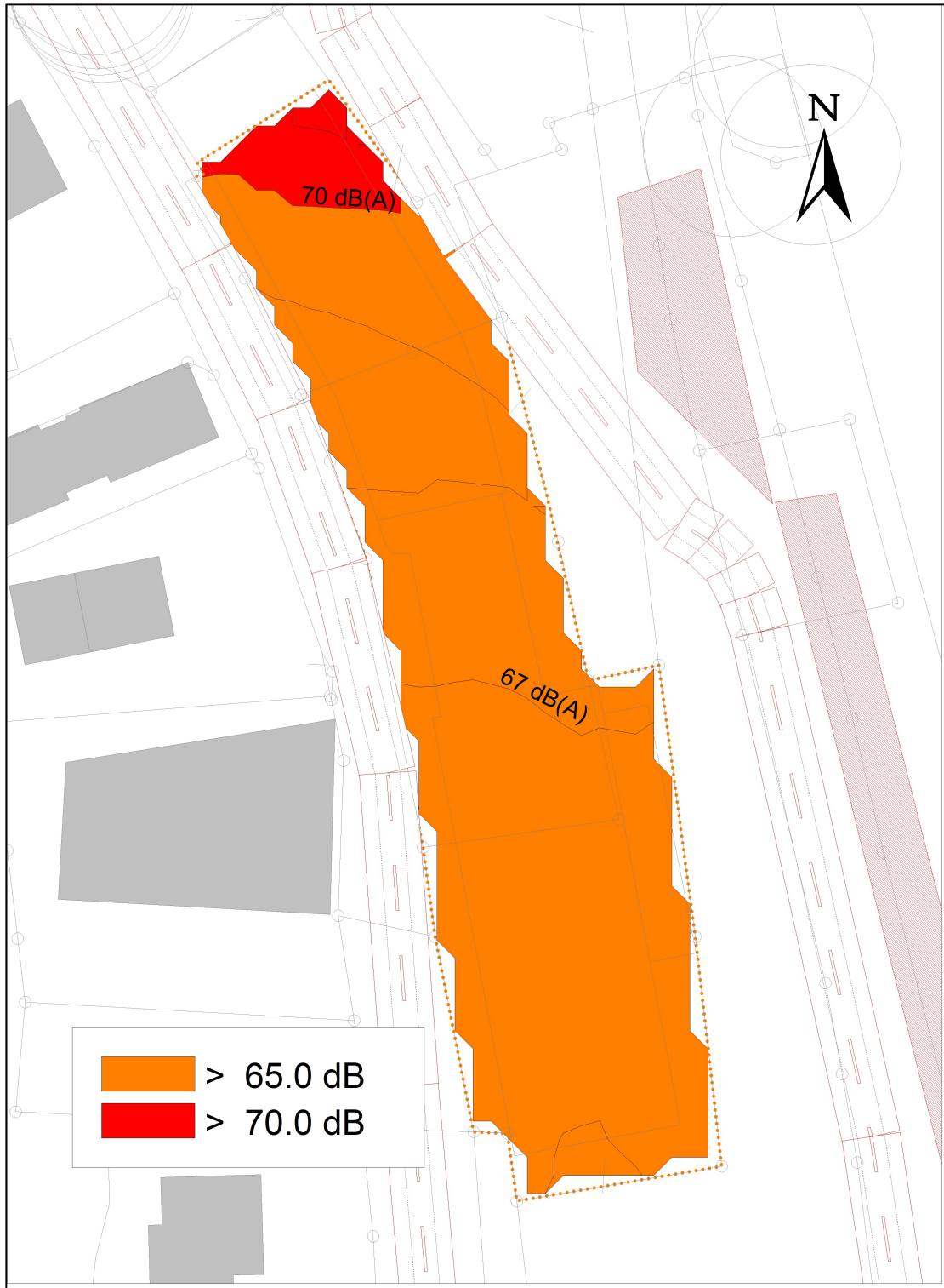
Abbildung 1 Maßgeblicher Außenlärmpegel für schutzbedürftige Räume (Abb. ohne Maßstab – im Bericht zur schalltechnischen Untersuchung M 1:750)