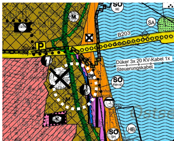
Abb.: Ausschnitt Flächennutzungsplan

Der Flächennutzungsplan stellt das Plangebiet als Teil ei-