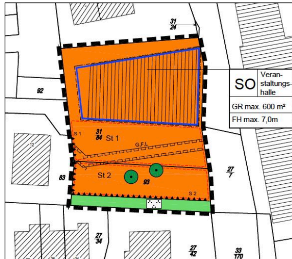
Abb.: Ausschnitt 1. Änderung BP Nr. 69