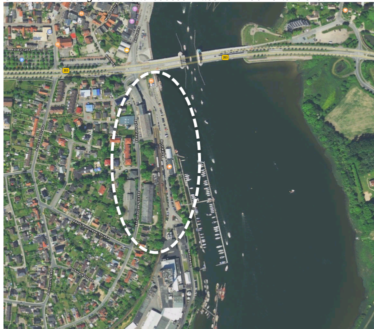
Plangebiet und Umgebung