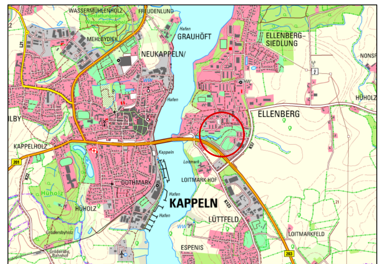
Übersichtsplan M 1:25 000

Aufgrund des § 10 des Baugesetzbuchs (BauGB) in der Fassung vom 3. November 2017 (BGBl. I S. 3634) sowie § 86 LBO in der Fassung vom 6. Dezember 2021 (GVOB. 2021, 1422) wird nach Beschlussfassung durch die Stadtvertretung vom ..... folgende Satzung über den Bebauungsplan Nr. 1 - 11. Änderung "Ellenberg - Wohnbebauung an den Regenrückhaltebecken" für das Gebiet nördlich ..... und westlich ..... bestehend aus den Flurstücken ..... (teilweise) und ..... (teilweise), bestehend aus der Planzeichnung (Teil A) und dem Text (Teil B), erlassen: