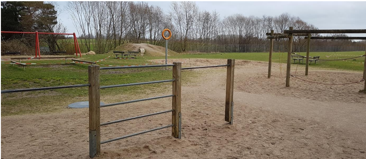
Abbildung 1: Spielplatz im Bestand, die Reckstangen und das Gerüst rechts im Bild sind marode und werden abgerissen

Die Initiative für den Natur-Erlebnisspielplatz "Landschaft Schwansen" ergab sich aus dem Neubau der Grundschule Karby. Mit dem sicheren Fortbestand des Standortes Karby (siehe Anlagen A01-A03), entwickelte sich die Idee, nicht nur das neue Schulgebäude zu gestalten, sondern auch den veralteten Schulhof neu zu entwickeln. Aufgrund fehlender finanzieller Möglichkeiten des Schulträgers bildete sich eine Arbeitsgruppe, bestehend aus Lehrern, Eltern und anderen Interessierten, und entwickelte ein umfassendes Konzept für eine naturnahe Gestaltung des Schulhofs als Begegnungs- und Erholungsort für alle.