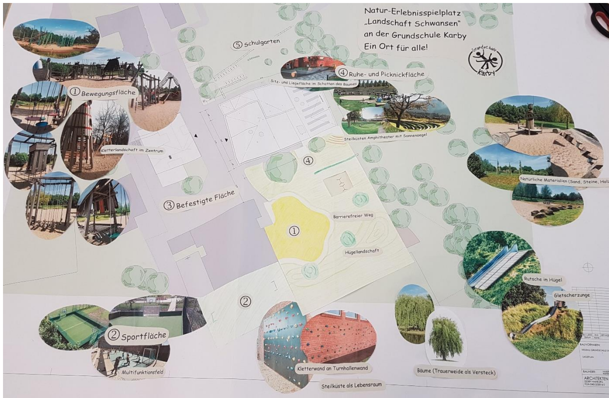
Abbildung 2: Konzept des Natur-Erlebnisspielplatzes Landschaft Schwansen